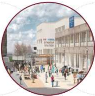
选定为构建首尔校园社区 的事业单位