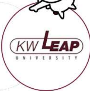
选定为支持大学创新的自 律协议大学事业单位