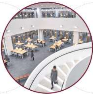
具备高尖端技术 ICT技术 的中央图书馆